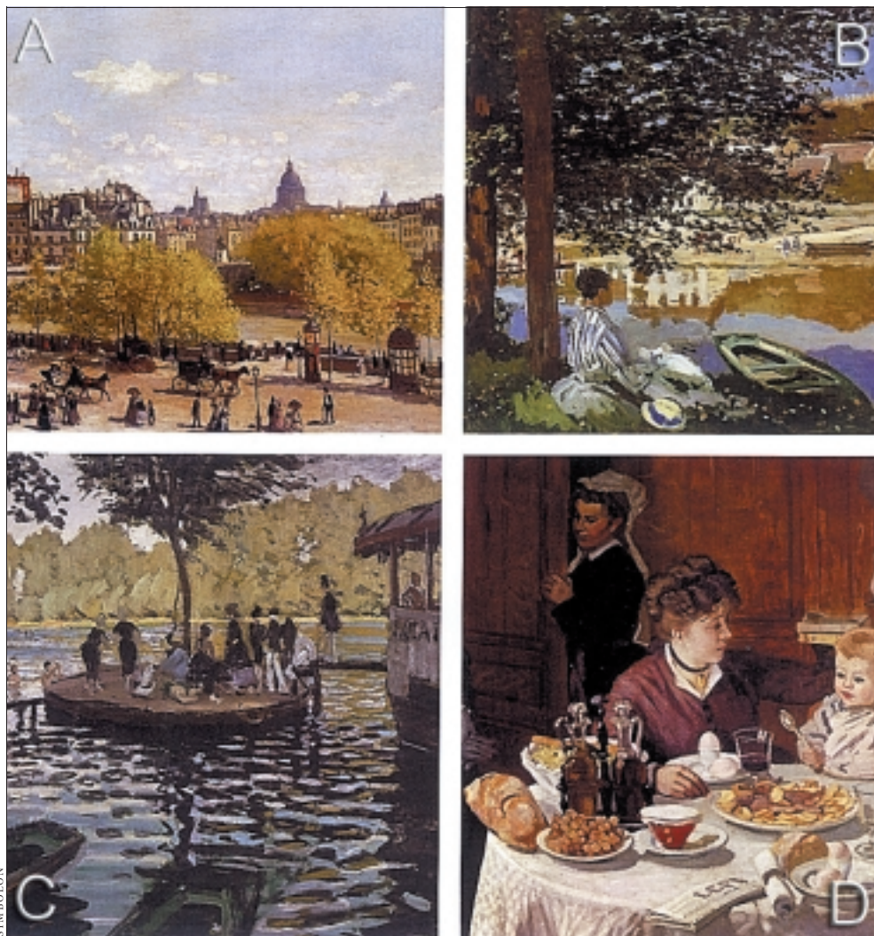
Mehr wissen über das eigene Teamverhalten: Welche Situation ist Ihnen sympathisch?

„Wenn Firmen das Profil für ihre Führungskräfte bestellen, ist klar, dass niemand außer der jeweiligen Person die Auswertung bekommt“, erklärt Kranz, die Voestalpine, Telekom Austria und Palfinger als Referenzen nennt.